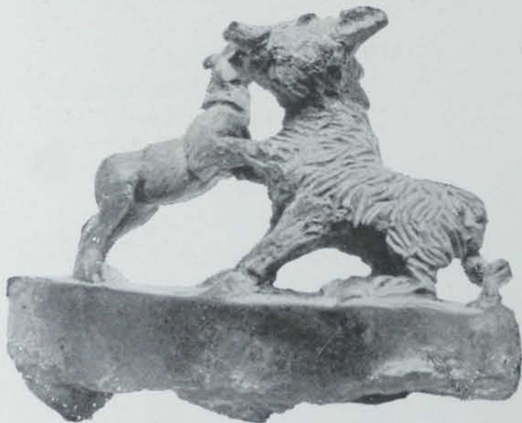
Fig. 34. — Bronze trobat a les excavacions de Solsona

trobaren troços de motllos (fig. 32), altres utensilis pera la fabricació dels objectes fragmentats (fig. 33) y un petit bronze que reproduim (fig. 34).