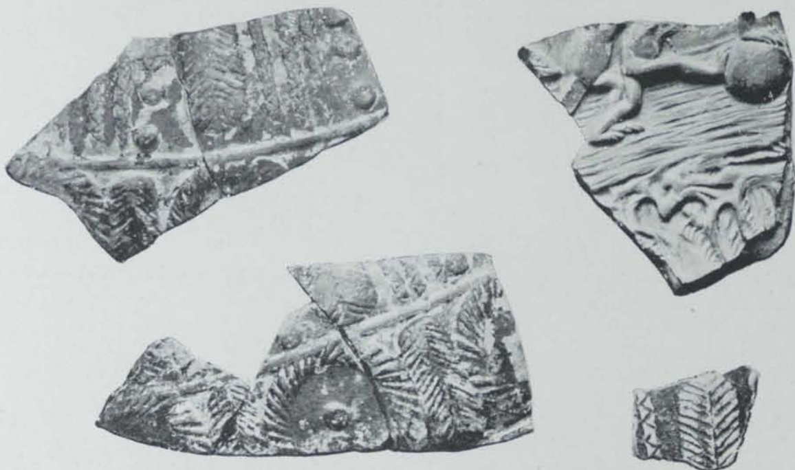
Fig. 33. — Fragments ceràmichs de les excavacions de Solsona

complet cap objecte, han sigut suficients pera donar idea de les formes més usuals, que son les de les «scurulæ» de que parla Martial, haventn'hi de molt variades dimensions. També s'hi